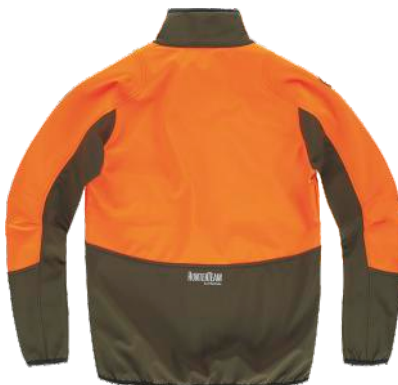
laranja fluor/verde caça