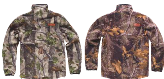
camuflagem floresta verde