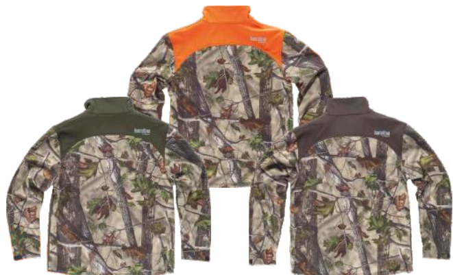
camuflagem verde floresta/verde caça