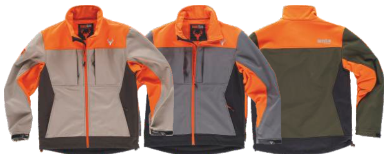
bege/castanho/laranja a.v. cinzento/preto/laranja a.v. verde caça/preto/laranja a.v.