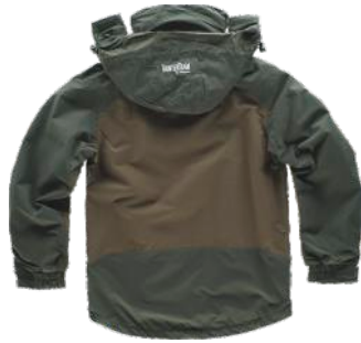
verde floresta/verde azeitona