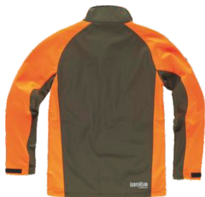
laranja fluor/verde caça