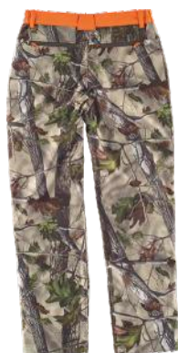
camuflagem verde floresta/laranja a.v.