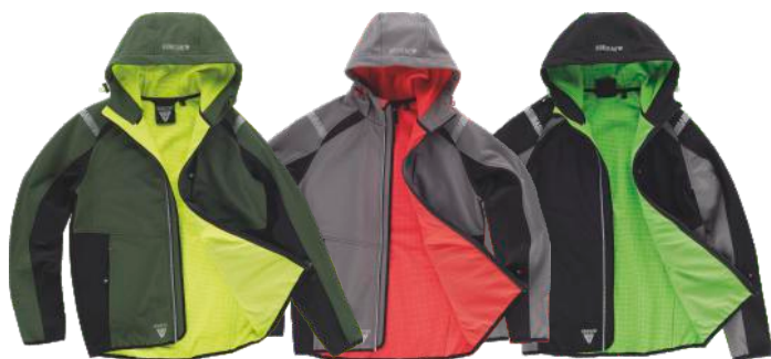
verde escuro/preto/amarelo a.v. cinza/preto/vermelho a.v. preto/cinza/verde flúor