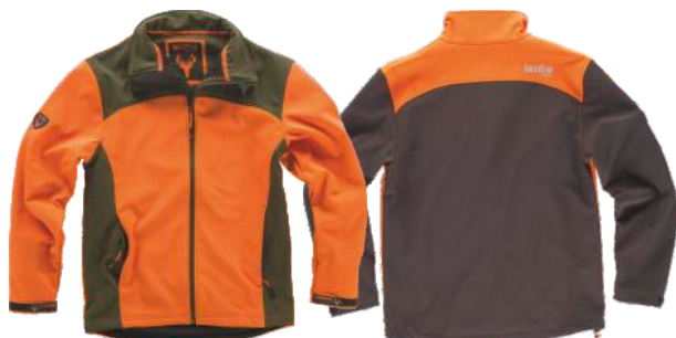
laranja a.v./verde caça