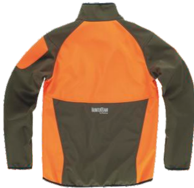
laranja fluor/verde caça