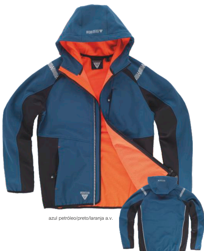
azul petróleo/preto/laranja a.v.