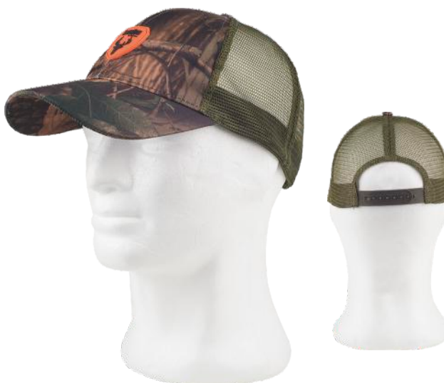
camuflagem forestal verde/verde caça