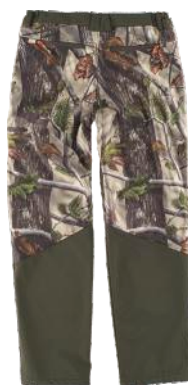
camuflagem verde floresta/castanho