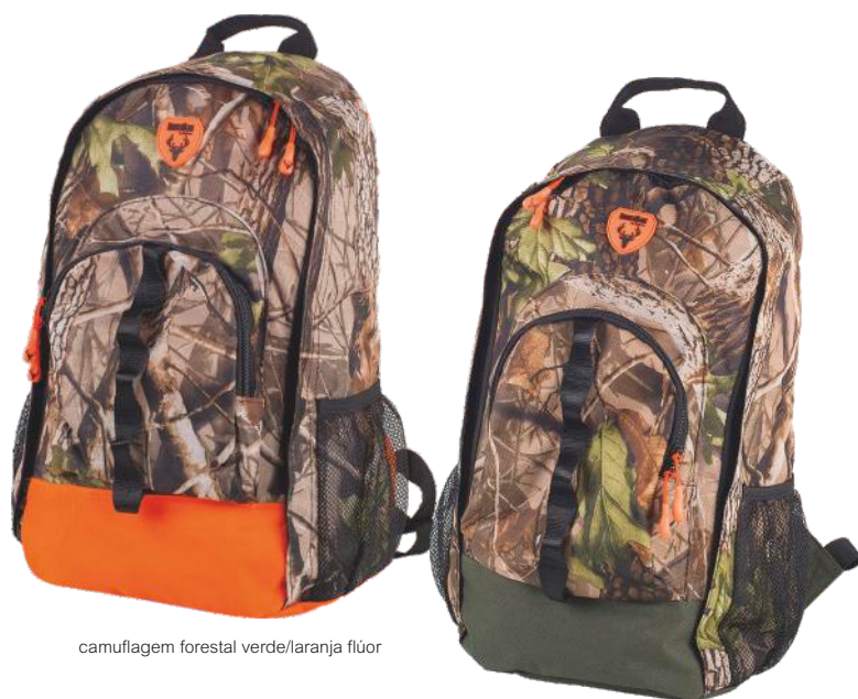
camuflagem forestal verde/laranja flúor