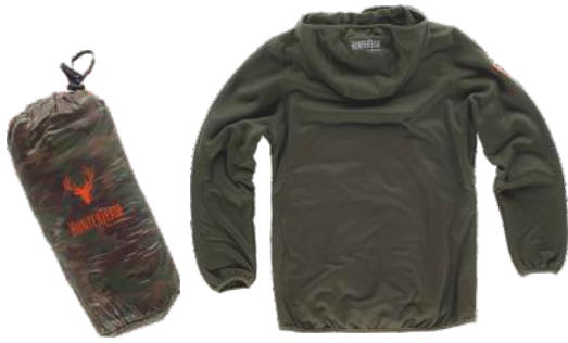
verde caça/camuflagem castanho