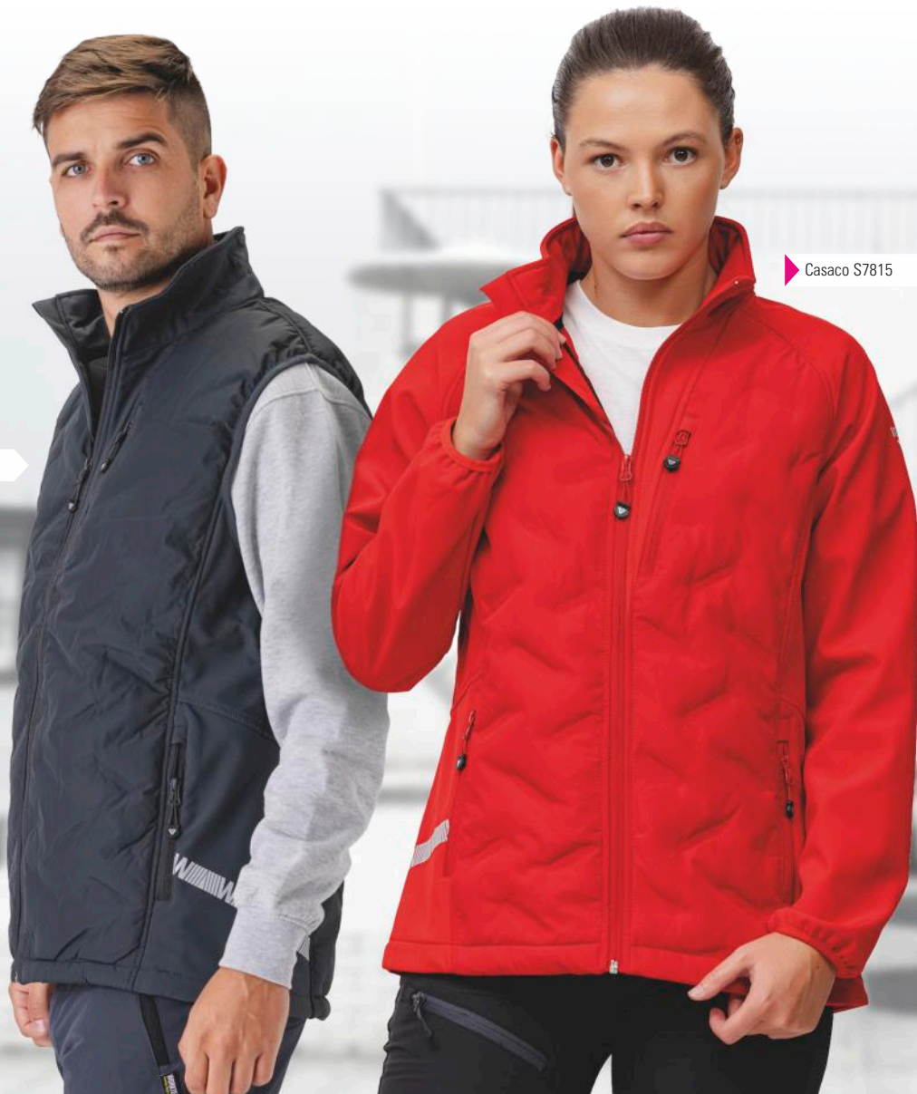
▶ Casaco S7815