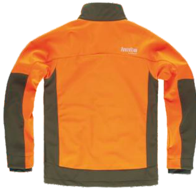
laranja fluor/verde caça