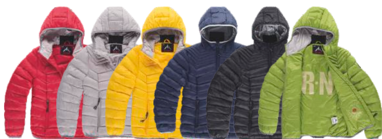
grená pérola amarelo escuro marinho preto verde grama