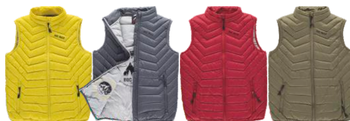
amarelo antracita grená caqui