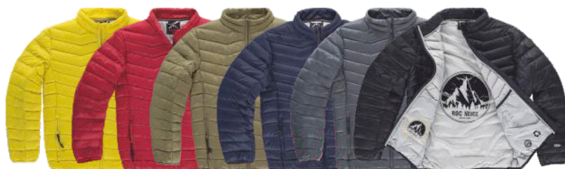
amarelo grená caqui marinho antracita preto