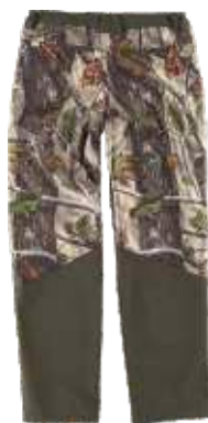
camuflagem verde floresta/ verde caça