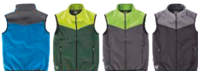
celeste/cinzeno verde escuro/amarelo a.v. cinzeno/verde lima preto/cinzeno