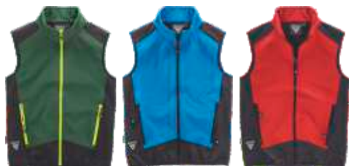
verde escuro/preto celeste/preto vermelho/preto