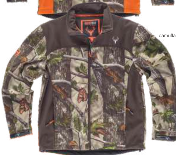
camuflagem verde floresta/castanho