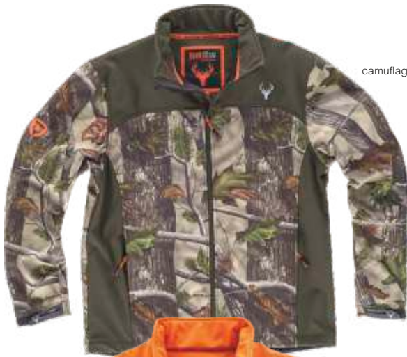
camuflagem verde floresta/verde caça