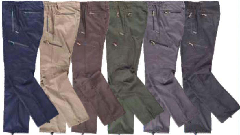
marinho bege castanho verde caça cinzento preto