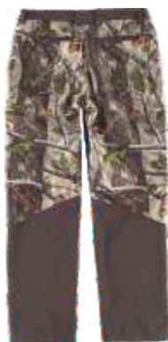
camuflagem verde floresta/castanho

Tecido Secundario: 96% Poliéster 4% Elastano (300 g/m2)