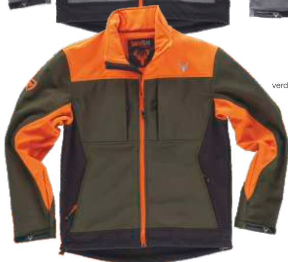
verde caça/preto/laranja a.v.