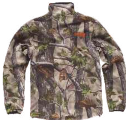
camuflagem floresta verde

Tecido: 96% Poliéster 4% Elastano (300 g/m 2 )