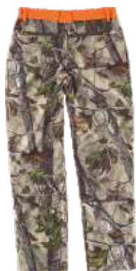
camuflagem verde floresta/laranja a.v.