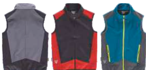
cizento/preto preto/vermelho azafata/cizento