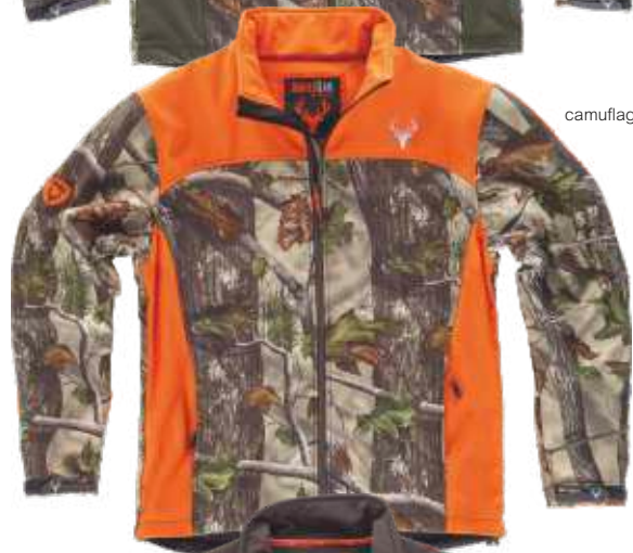
camuflagem verde floresta/laranja a.v.