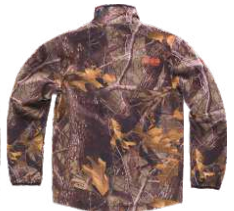
camuflagem floresta castanho