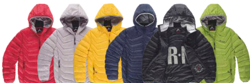
grená pérola amarelo escuro marinho preto verde grama