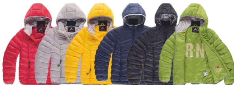
grená pérola amarelo escuro marinho preto verde grama