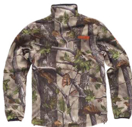
camuflagem floresta verde

Tecido: 96% Poliéster 4% Elastano (300 g/m 2 )