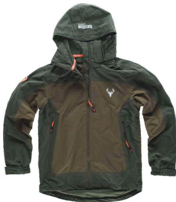
verde floresta/verde azeitona

Tecido Interno: 100% Poliéster (65 g/m2)