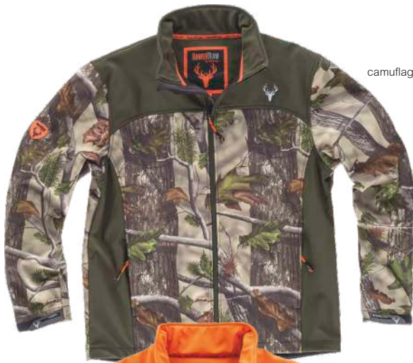
camuflagem verde floresta/verde caça