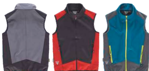
cizento/preto preto/vermelho azafata/cizento