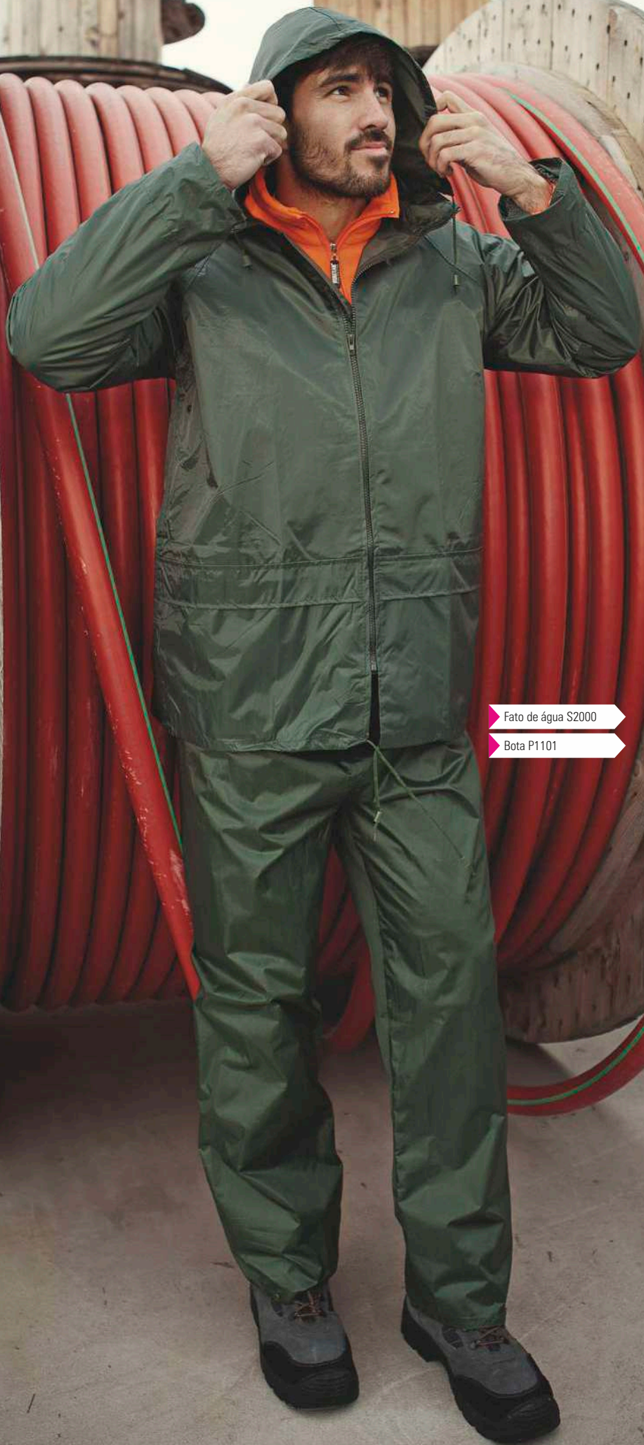
Fato de água S2000