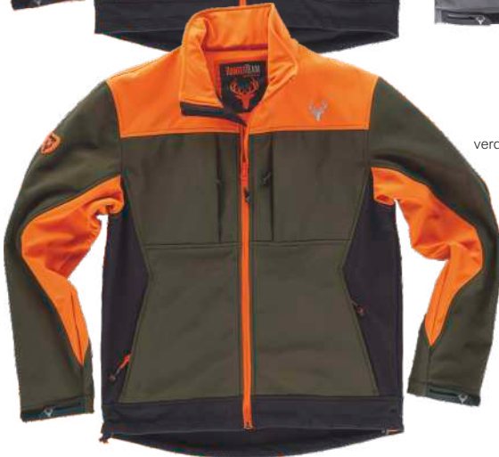
verde caça/preto/laranja a.v.