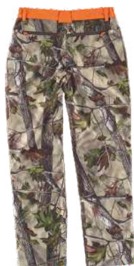
camuflagem verde floresta/laranja a.v.