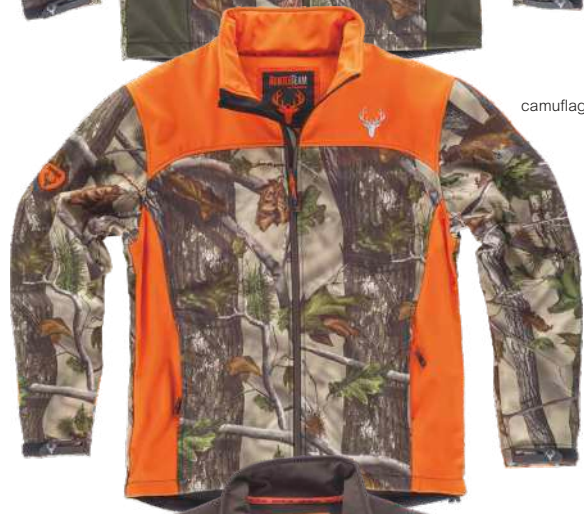
camuflagem verde floresta/laranja a.v.