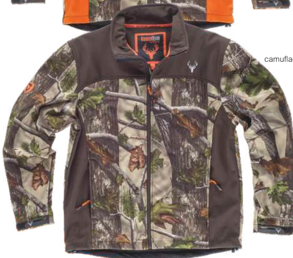
camuflagem verde floresta/castanho