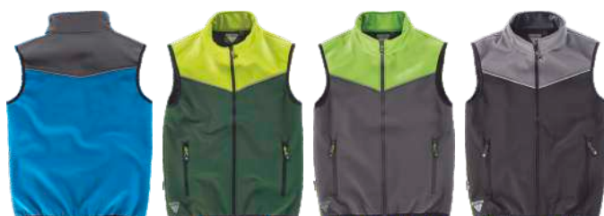
celeste/cinzeno verde escuro/amarelo a.v. cinzeno/verde lima preto/cinzeno