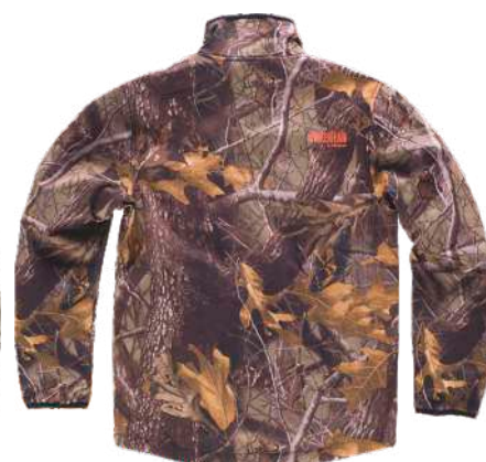
camuflagem floresta castanho