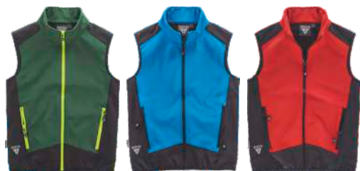
verde escuro/preto celeste/preto vermelho/preto