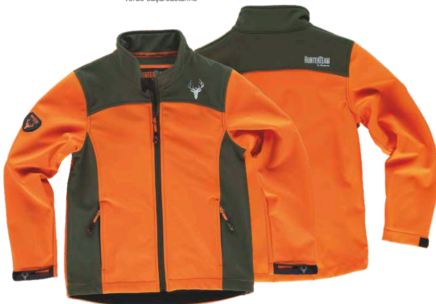
laranja a.v./verde caça

Tecido: 96% Poliéster 4% Elastano (300 g/m2)