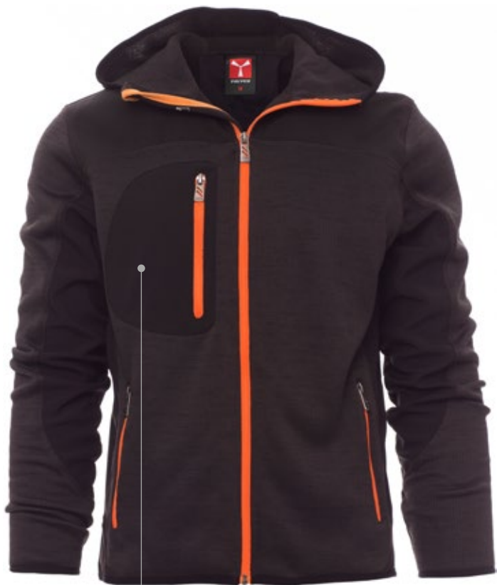
BOLSILLO CONTORNEADO CON CREMALLERA