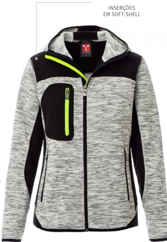
INSERCIONES DE SOFT-SHELL